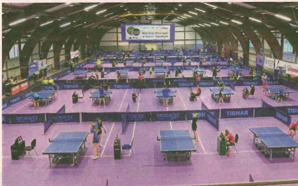
► Tak wygląda hala w Drzonkowie w całej okazałości. łącznie na 45 stołach rywalizowały dzieci w różnym wieku. Każdy chciał zwyciężyć i zaprezentować się jak najlepiej.

Drzonków po raz kolejny zorganizował świetny turniej dla dzieci