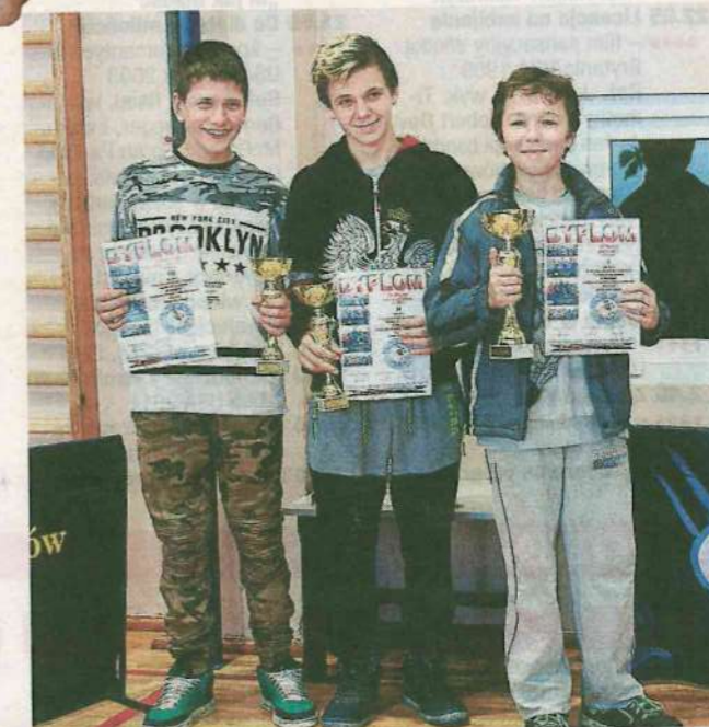
Zadowoleni zwycięzcy rozgrywek w kategorii szkoła podstawowa eksponują dyplomy i puchary turniejowe