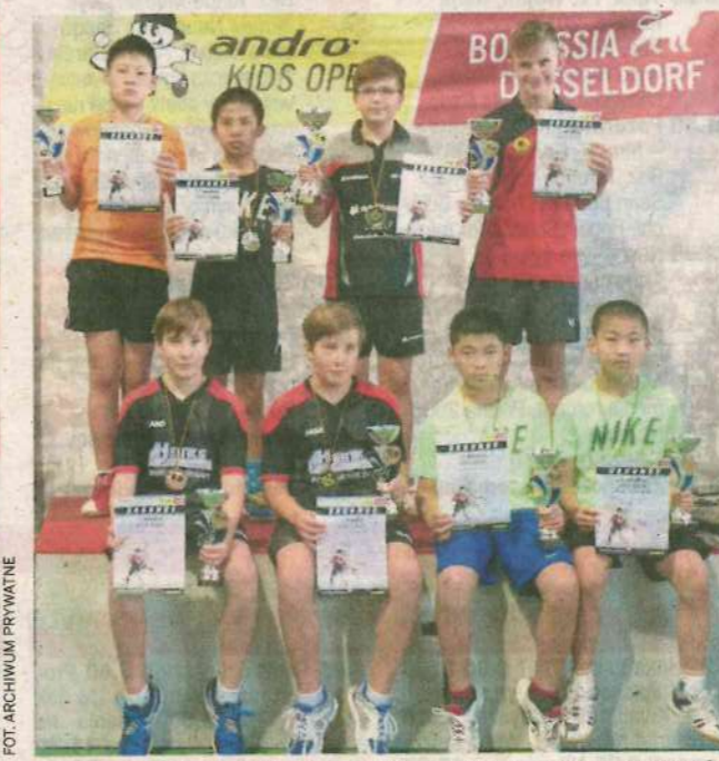
Okolicznościowe zdjęcie z ceremonii wręczenia pucharów, medali i dyplomów najlepszym uczestnikom gry debłowej