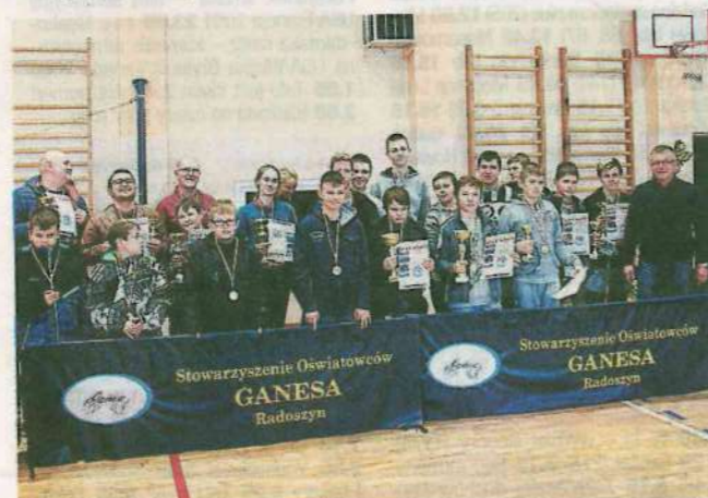
Takie inicjatywy, jak turniej mikołajkowy, służą propagowaniu tej dyscypliny, a przede wszystkim aktywności