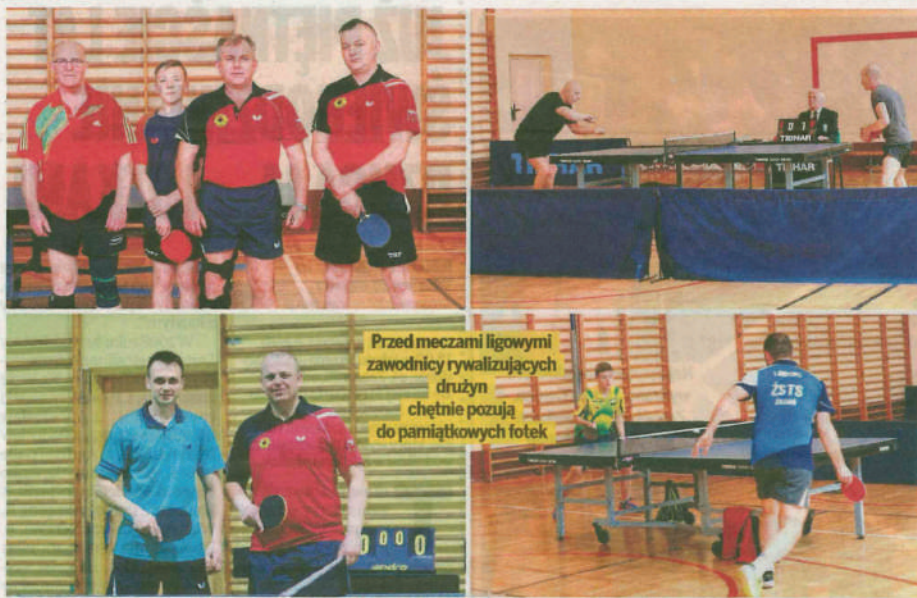
Przed meczami ligowymi zawodnicy rywalizujących drużyn chętnie pozują do pamiątkowych fotek