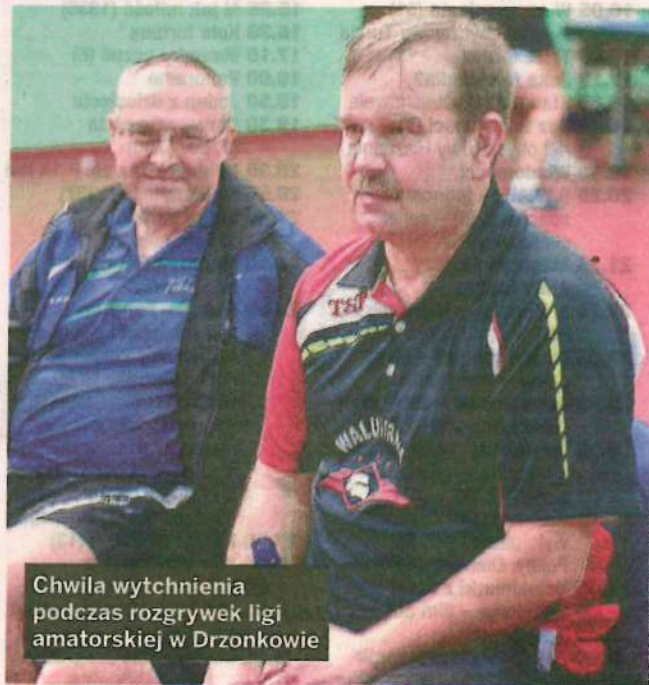
Chwila wytchnienia podczas rozgrywek ligi amatorskiej w Drzonkowie