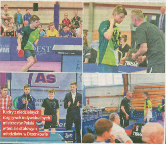
Kadry z niedzielnych rozgrywek indywidualnych mistrzostw Polski w tenisie stołowym młodzików w Drzonkowie