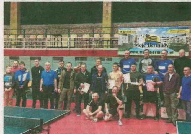
Wspólne zdjęcie uczestników sylwestrowego turnieju tenisa stołowego 30 grudnia w Grzowie Wielkopolskim